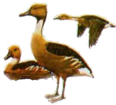
PATO SIRIRI COMÚN ( Dendrocygna bicolor )