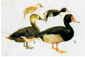
PATO CRESTÓN ( Netta peposaca )