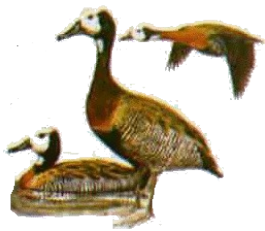
PATO SIRIRI PAMPA ( Dendrocygna viduata )